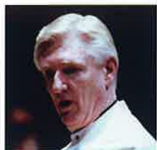
芸術監督/指揮者 リチャード・パンチャス

日本香港観光交流年 Hong Kong - Japan Tourism Exchange Year 2009