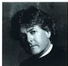
首席指揮者 ジェームズ・ジャッド