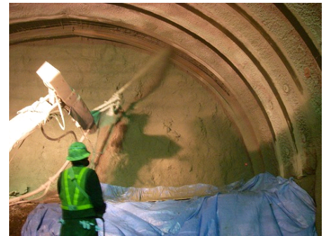
写真-1 吹付け試験状況