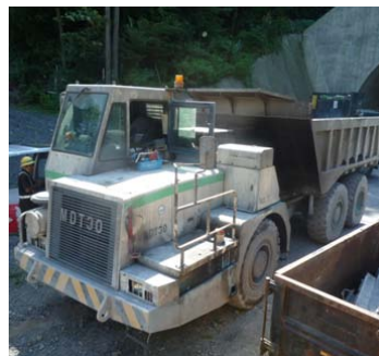
図-2 アーキティキュレートダンプ