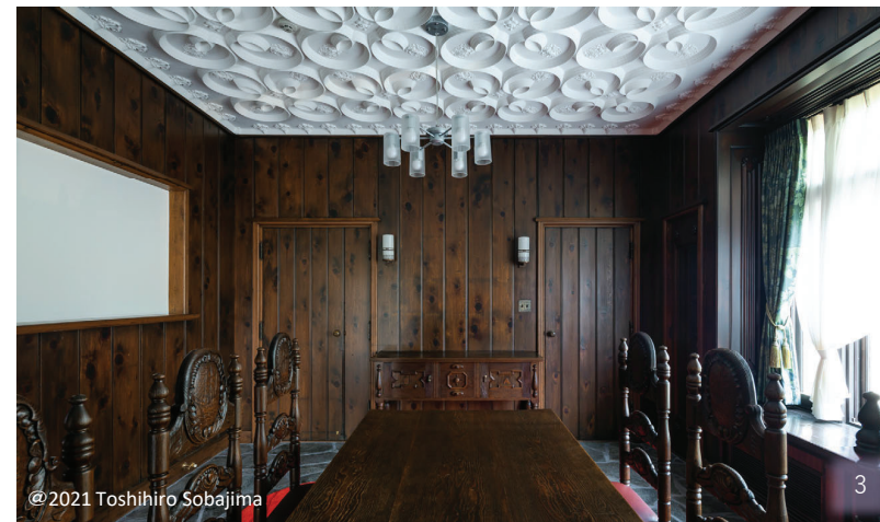
@2021 Toshihiro Sobajima